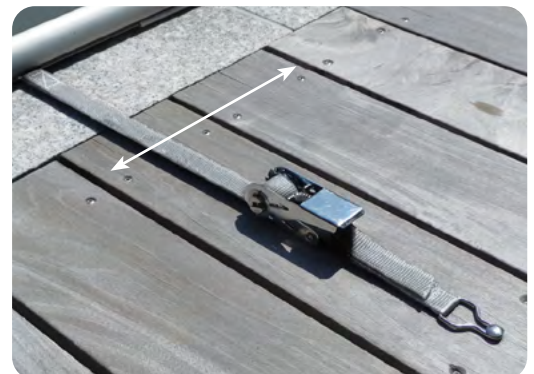
Cliquet de tension