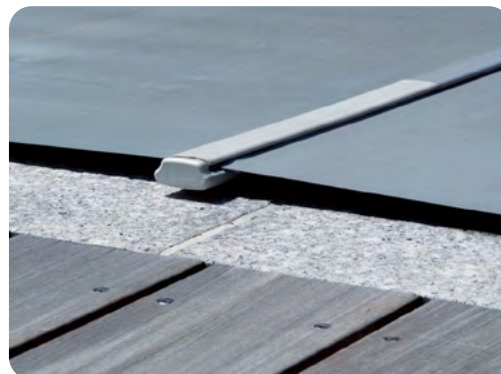
Barre de maintien en aluminium anodisé à embouts aplatis