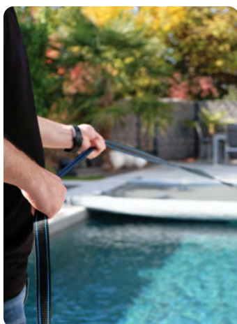
Sangle de déroulement