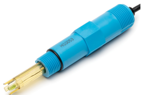
HI10053 Électrode pH/°C amplifiée